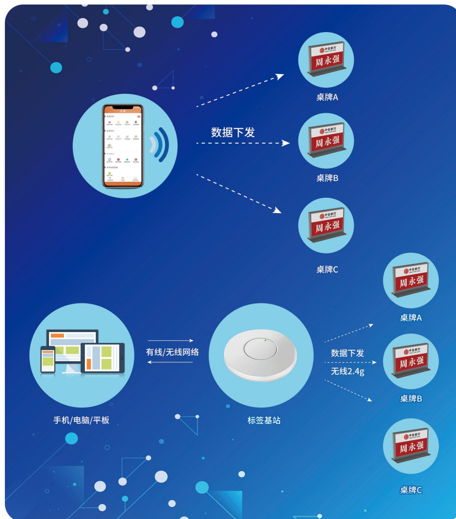
【AS-OD756M3L 蓝牙基站连接系统拓扑图】

系统也可以采用基站+PC 管理模式，基站可级联，实现信息并发传输，桌牌响应速度更快，适用于大型会场，大型发布会或者多会场同时管理。